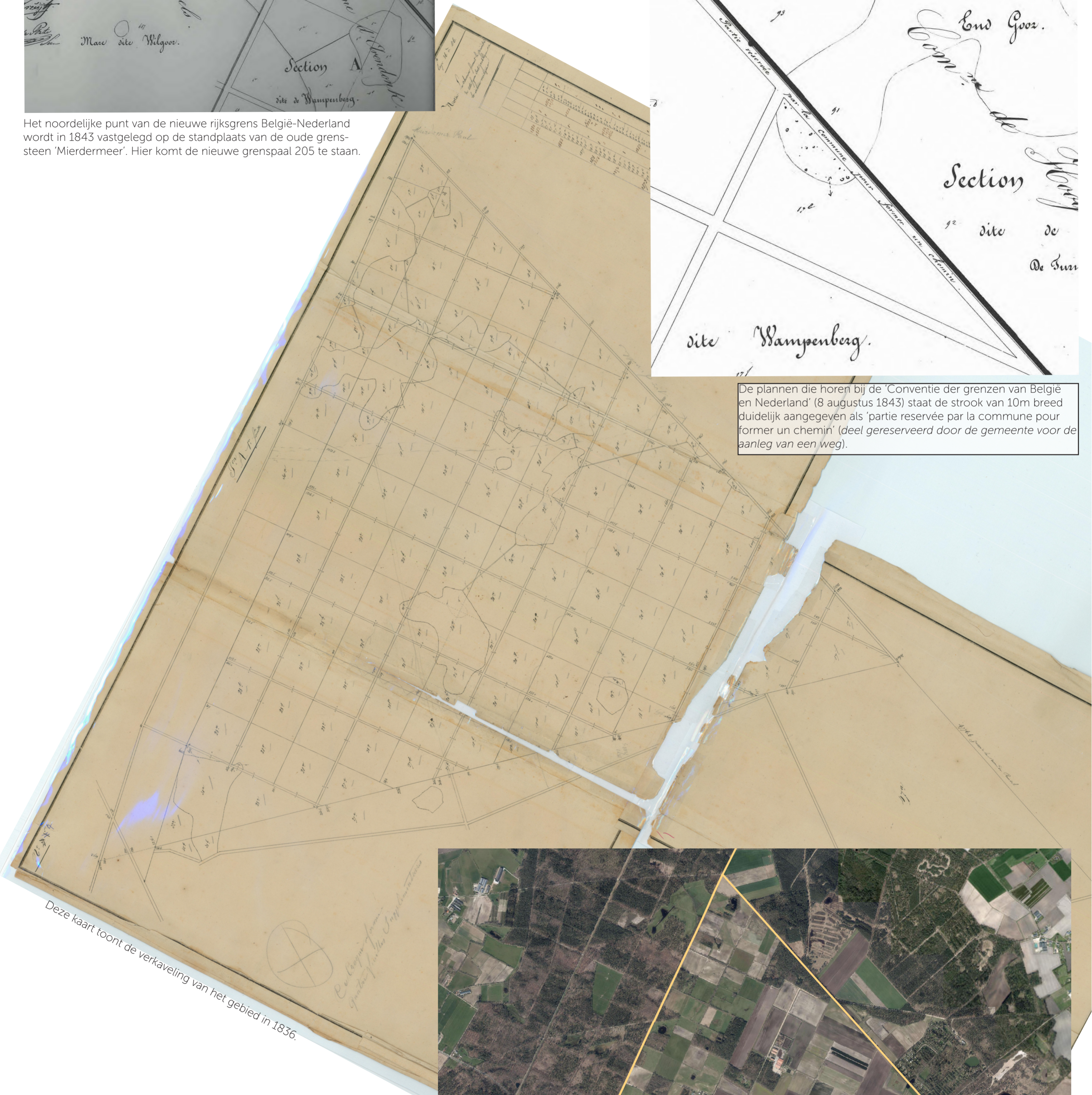
Deze kaart toont de verkaveling van het gebied in 1836.