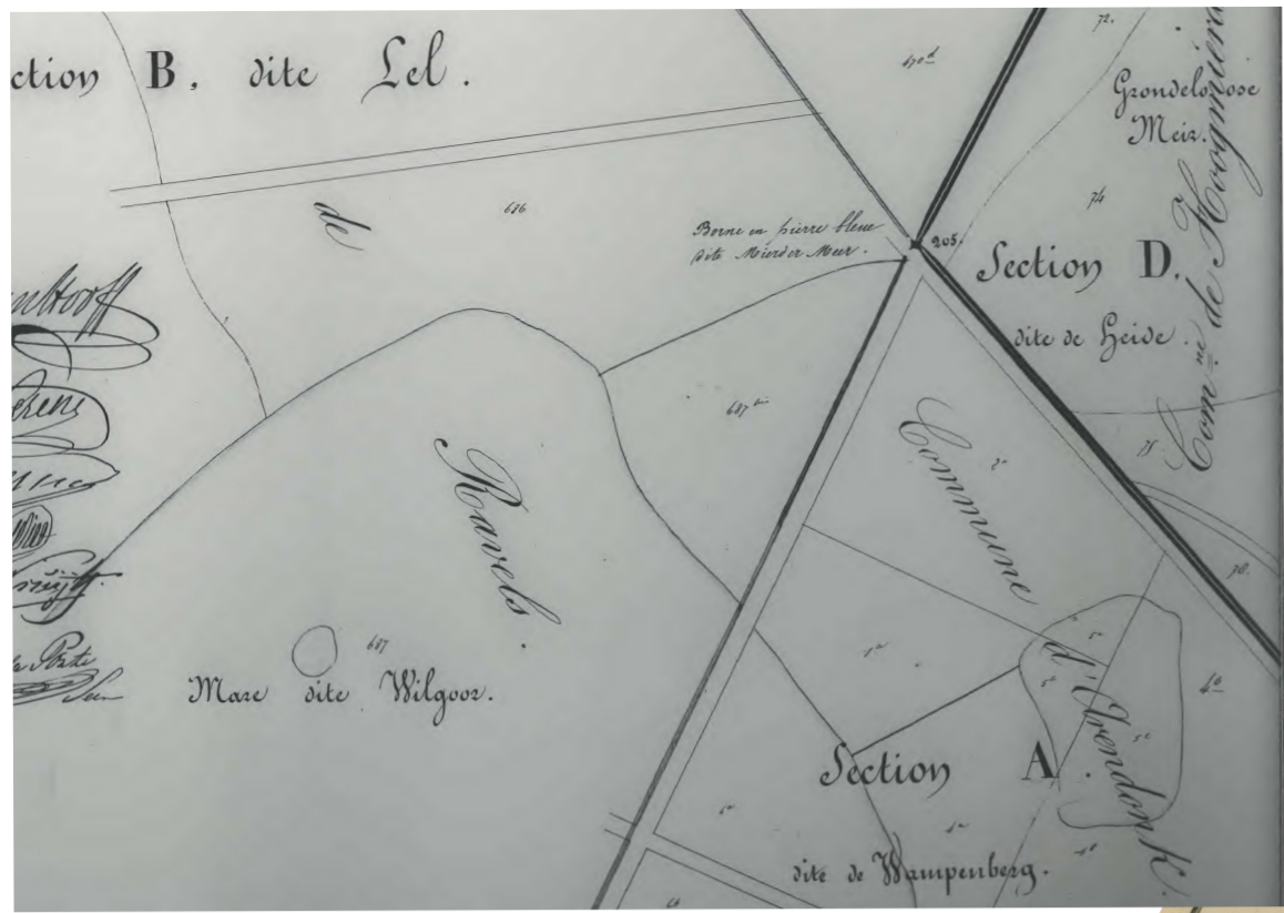
Het noordelijke punt van de nieuwe rijksgrens België-Nederland wordt in 1843 vastgelegd op de standplaats van de oude grenssteen 'Mierdermeer'. Hier komt de nieuwe grenspaal 205 te staan.